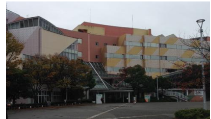
会場のセンター棟309号室

この2日間で更に近隣県事務局とのネットワークが強くなった。大きな変革を目前に控え、ブロック内の情報交換を密にしながら、スカウト数の増加や活動の充実を図るとともに、今後の日本連盟の動向に注目していきたい。