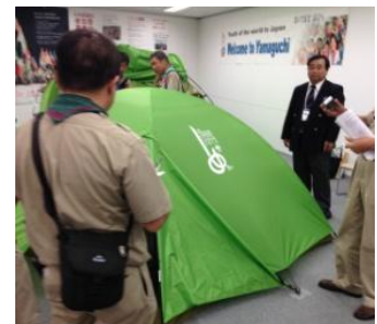
スカウト用品の展示販売