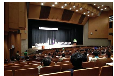
市民会館での表彰式