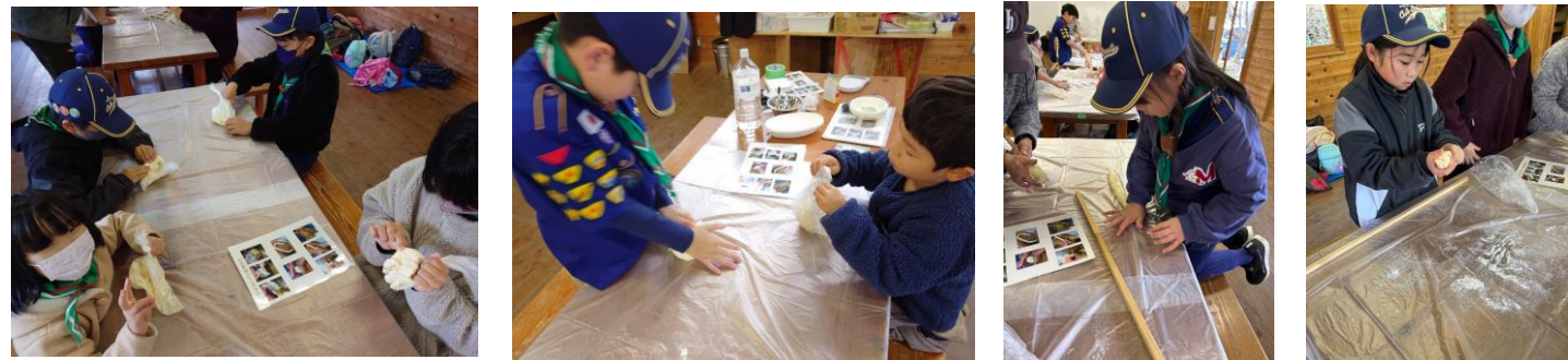
12/23 土曜部ツイストパン作り 袋に材料を入れてこねます 手で伸ばして、棒に巻き付けます