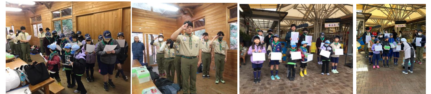
1/20 能登半島地震義援金募金活動 「内子フレッシュパークからり」にて募金活動