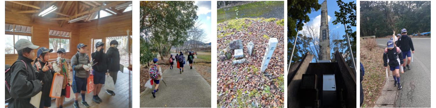
1/13 ボーイ隊 課題ハイキング 龍王城址を目指して 三角点 忠魂碑 ゴミ袋を持って