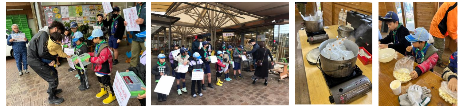
ご協力ありがとうございました