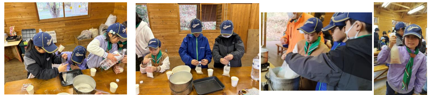
ポリ袋でのご飯炊き(お米と水の量を計算します。米1:水1.2。無洗米は水1~2割増し)できました