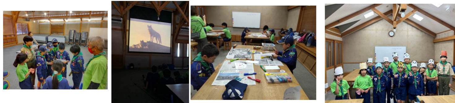
9/24 カブ隊 アキーラからの手紙&ジャングルブック鑑賞 カブラリー参加の動物のお面づくり