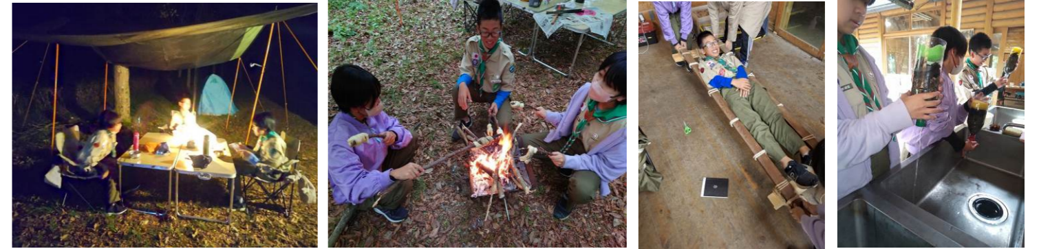
10/7～9 ボーイ隊班キャンプ