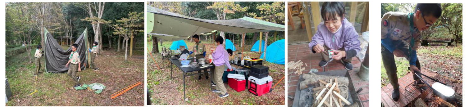
タープ・テント設営