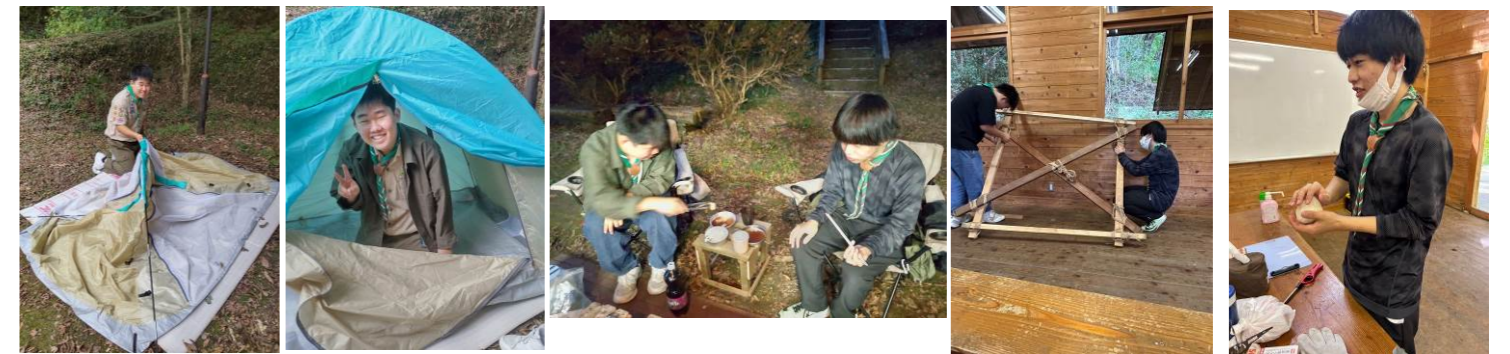
10/14～15 ベンチャー隊野営