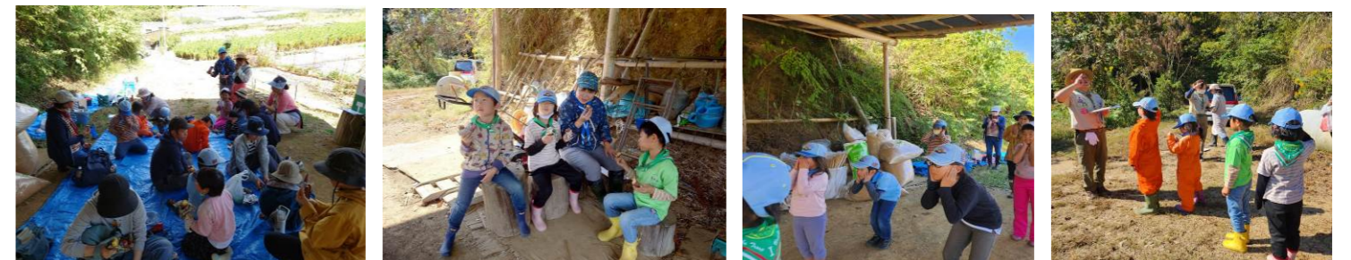
10/22 南予地区【さつまいの収穫祭】 開会式、焼き芋準備、さつまい掘り、ゲーム、美味しい焼き芋