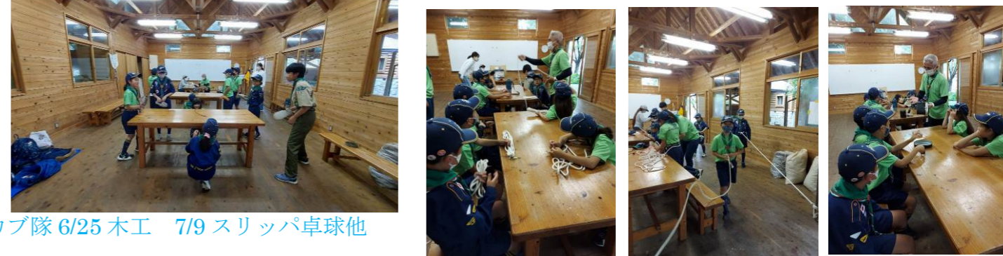
カブ隊 6/25 木工 7/9 スリッパ卓球他