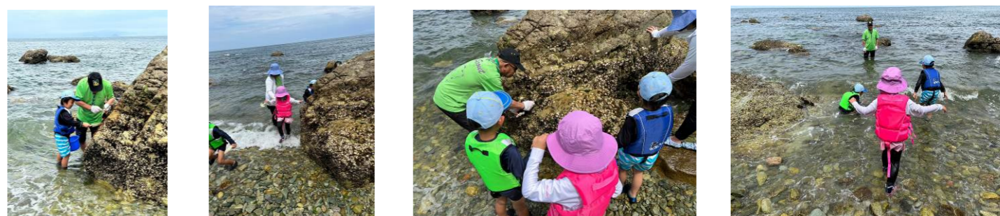
ビーバー隊 7/2 魚釣り、お菓子釣り、スライムづくり 7/15 磯遊び