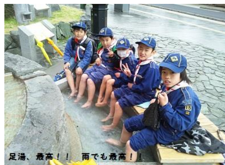
足湯、最高！！ 雨でも最高！！