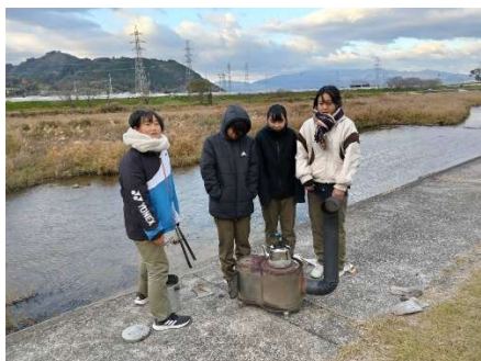
釜戸の近くは大人気