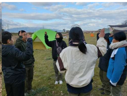
スカウトズタウン