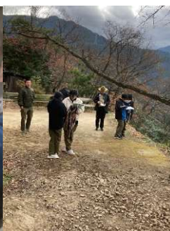
バックベアリング